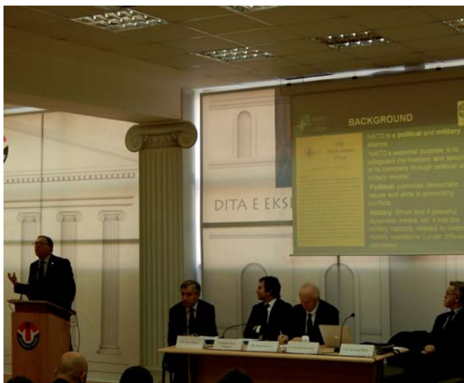
Il generale Giuseppe Morabito interviene ad un incontro internazionale